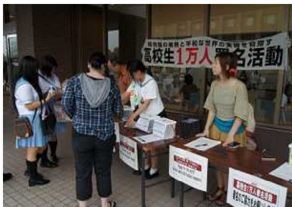
2011年度 オープンキャンパスでの 「高校生1万人署名活動」の様子